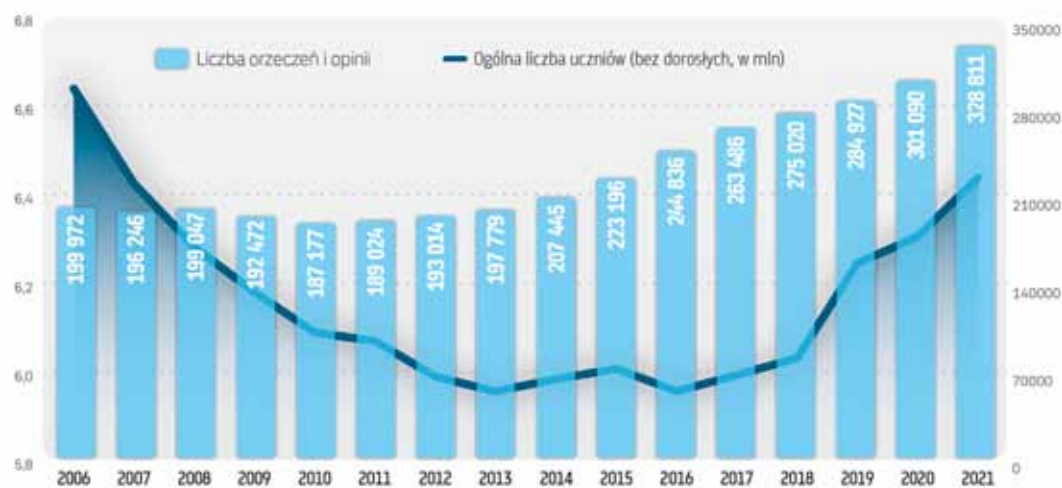
Liczba uczniów z orzeczeniami/opiniami vs ogólna liczba uczniów w latach 2006–2021

Czy w polskich placówkach edukacyjnych udaje się zapewnić dzieciom harmonijny rozwój, za-