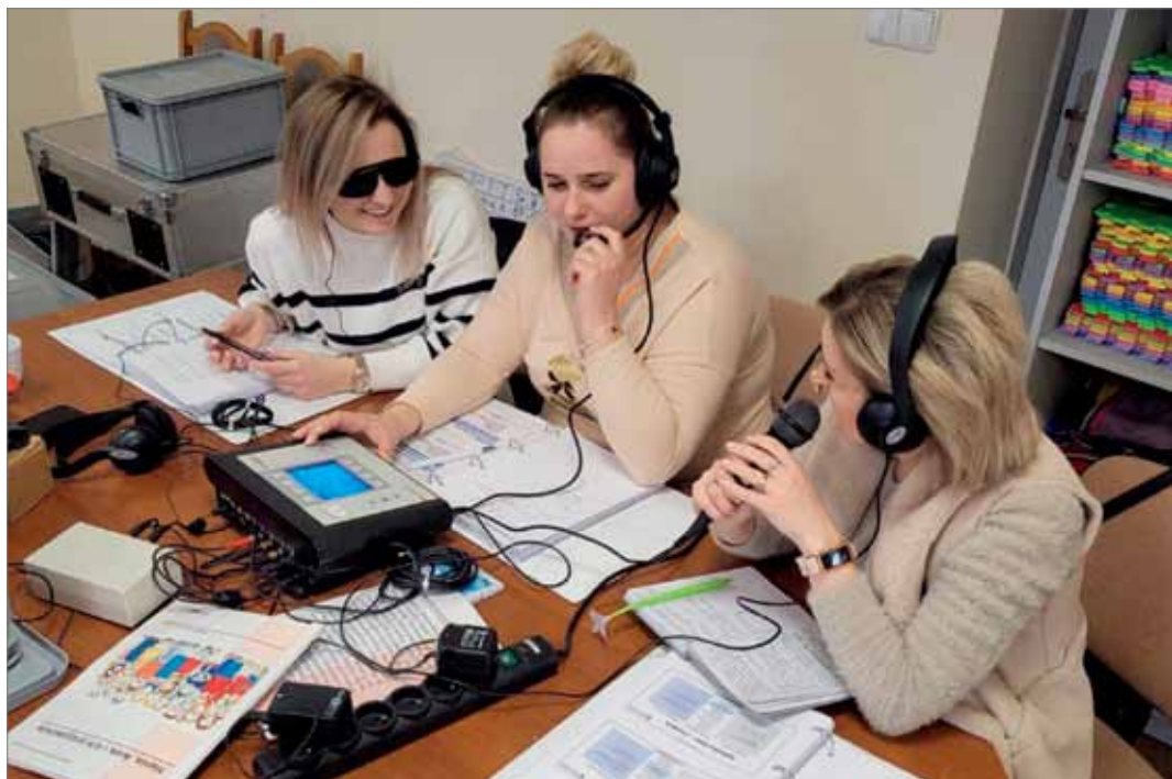
▲ SCWEW w Brzegu Dolnym. Szkolenia podnoszące kompetencje kadry pedagogicznej

wsparcia dla całej rodziny i koordynować wsparcie między różnymi instytucjami”. Tym innowacyjno-wdrożeniowym projektem objętych będzie 48 powiatów.